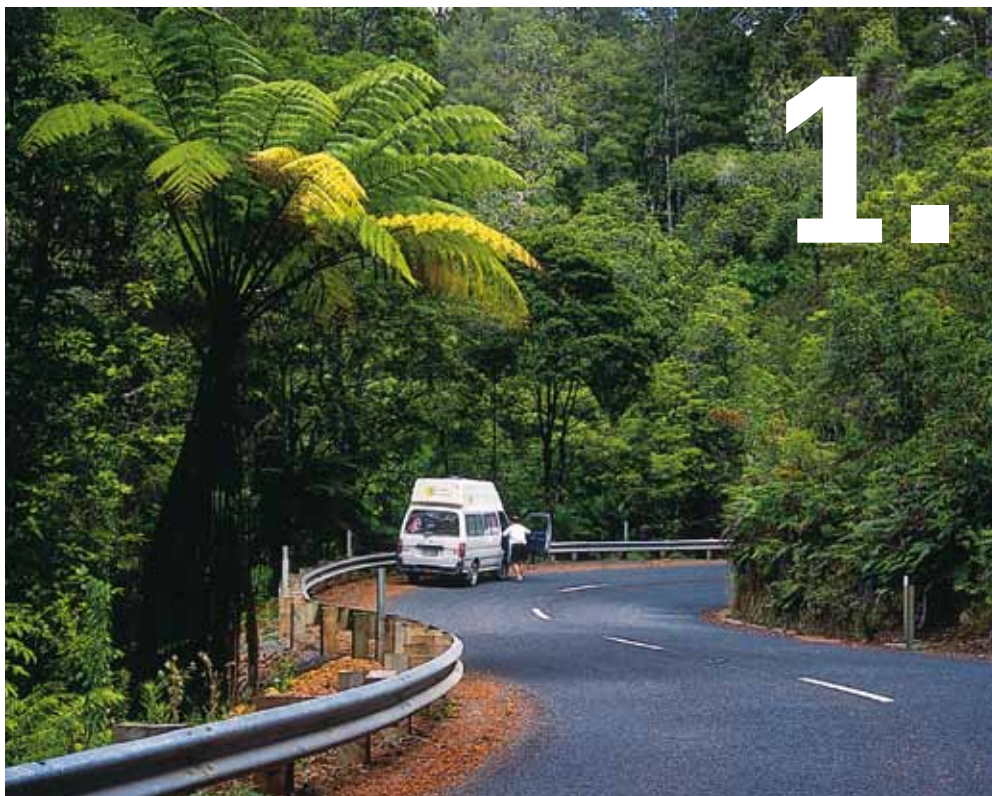
De weg door het Waipoua Forest is omgeven door varens en hoge kauri bomen.

De westkust is dunner bevolkt en ruiger. Cape Reinga is het meest noordelijke punt van Nieuw-Zeeland, hier botsen de Tasmaanse Zee en de Pacific op elkaar. Via lange stranden en grote zandduinen verdwijnt de weg uiteindelijk in het Waipoua Forest, waar 85% van alle inheemse kauri bomen groeien. I Tane Mahuta is met een hoogte van 51 meter en een doorsnede van 13 meter één van de laatst overgebleven giganten onder de kauri bomen.