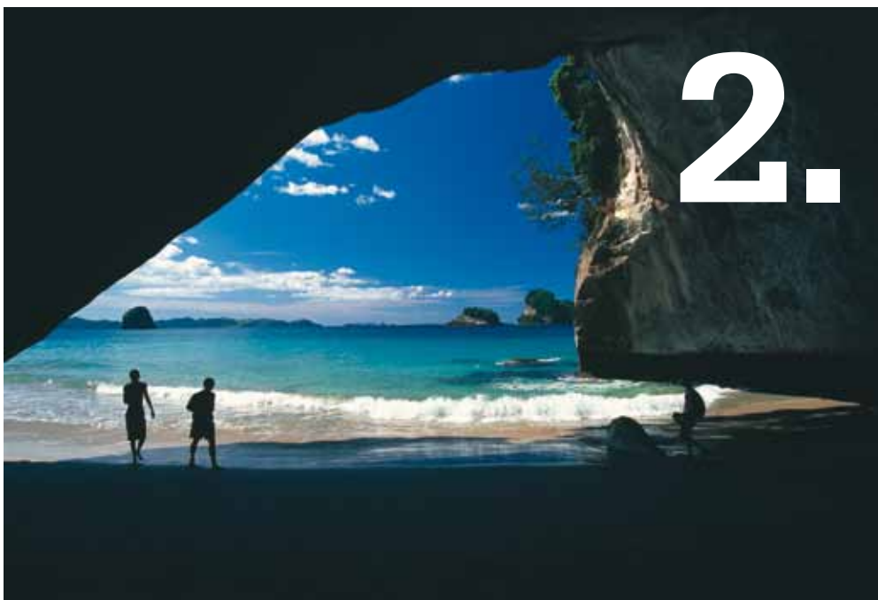
De magische Cathedral Cove is alleen toegankelijk te voet, per boot of zeekajak.

Mt Maunganui, de bekendste badplaats van Nieuw-Zeeland, is het eindpunt van deze scenic route . Naast zonnebaden en zwemmen kun je er prachtige lange strandwandelingen maken, paardrijden, de golven bedwingen op een surfboard en door middel van een boottocht genieten van de nieuwsgierige dolfijnen. In deze baai, Bay of Plenty, ligt ook de actieve vulkaan White Island, die tevens het startpunt vormt van de volgende scenic drive : de Thermal Explorer Highway.